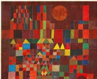
Kasteel en zon

De kleuters laten zich inspireren door Paul Klee.